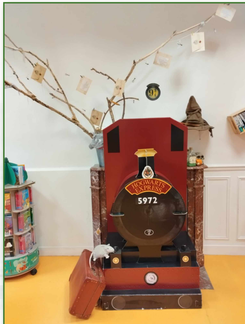
Décors de l'animation Harry Potter