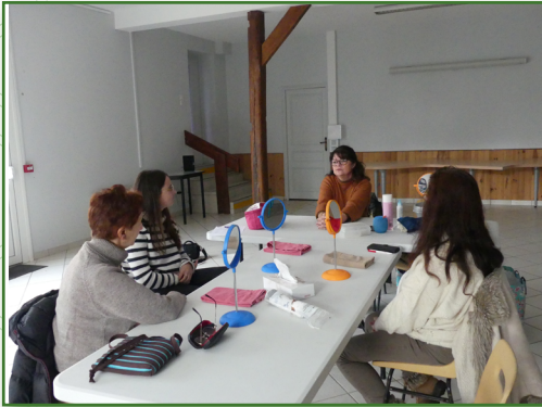
Atelier de soins socio-esthétiques

En partenariat avec le CCAS, la Mutualité Française a proposé des rencontres santé sur le thème « Prenons soin de ceux qui aident ».