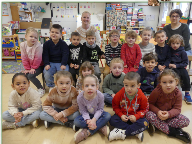
Classe de moyenne et grande section