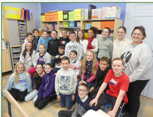
Classe de CM2