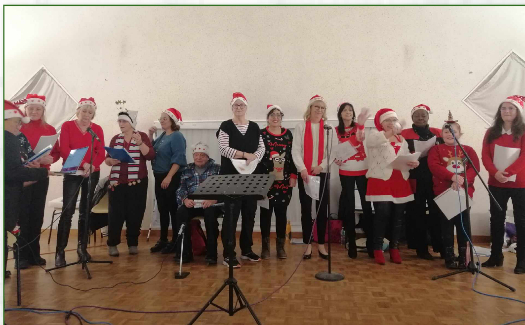
La chorale Chant'Aunay au marché de Noël