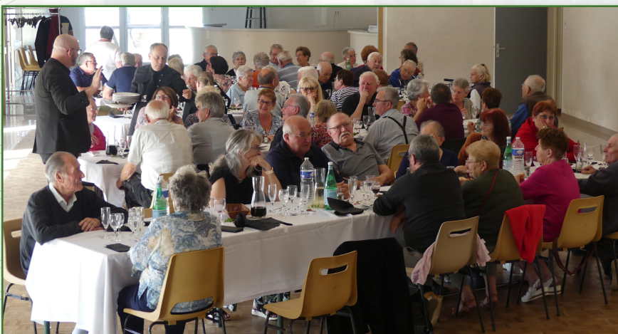
Repas de l'Amitié du 7 octobre 2023

Rendez-vous est pris pour l'année suivante !