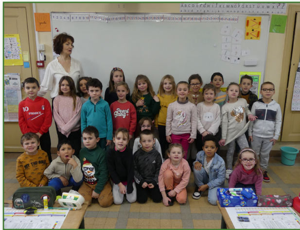
Classe de CP

À la rentrée 2023, 142 élèves sont répartis en 6 classes :