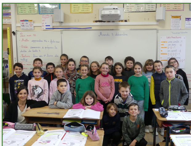
Classe de CM1

Ce thème viendra donc nourrir l'ambition de l'école d'ouvrir les esprits et d'instaurer le vivre ensemble dans le respect des différences.