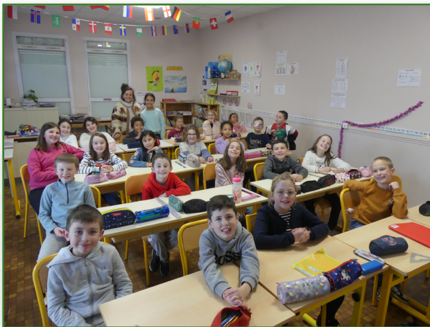
Classe de CE2-CM1

Cette année, les élèves de l'école des Hirondelles voyageront autour du monde. Ce fil rouge guidera leurs découvertes à travers les 5 continents et l'exposition de fin d'année permettra de mettre en valeur leur travail.