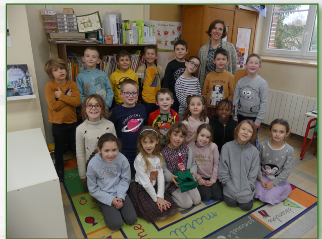
Classe de CE1