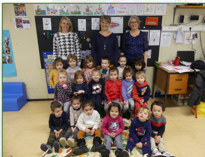
Classe de petite section

Et à l'issue de tout ce travail nous aurons le plaisir de vous accueillir à notre Mus'école en fin d'année : exposition des œuvres réalisées par les enfants et inspirées d'artistes étudiés dans les trois classes.