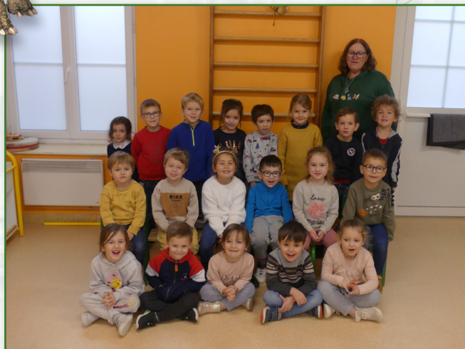
Classe de moyenne et grande section