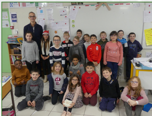
Classe de CE2