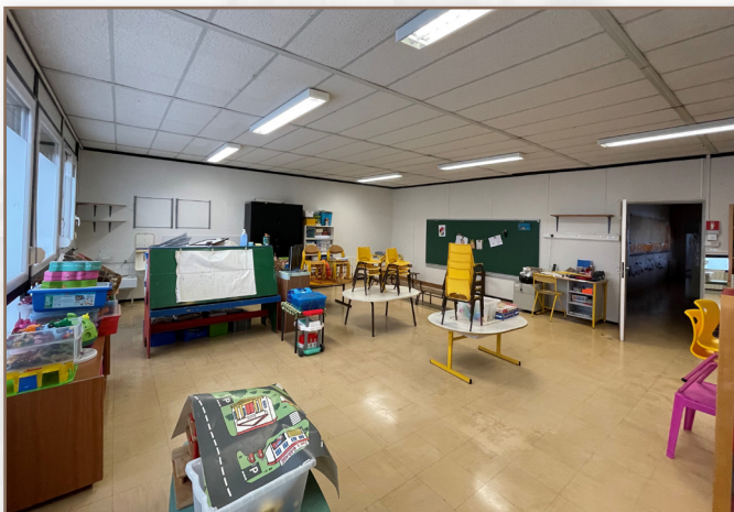
Peinture classe de maternelle