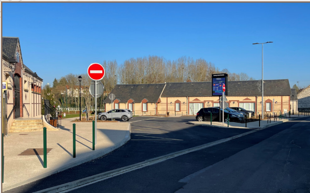
Zone sécurisée devant l'école élémentaire