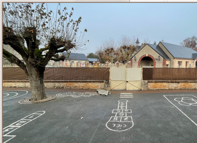
Remplacement du brise vue de de l'école maternelle