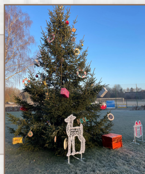
Décoration du sapin grâce aux réalisations confectionnées par les enfants de l'ALSH.