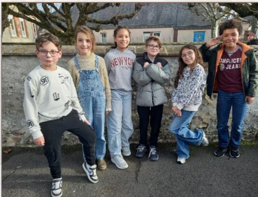
Élections des délégués de classe en cycle 3

Ce premier semestre riche et créatif a également permis aux élèves de travailler leurs compétences sur des thèmes propres à l'actualité et à l'éducation à la citoyenneté : la commémoration du 11 novembre, le harcèlement et la laïcité.