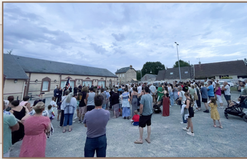
Commémoration du 14 juillet