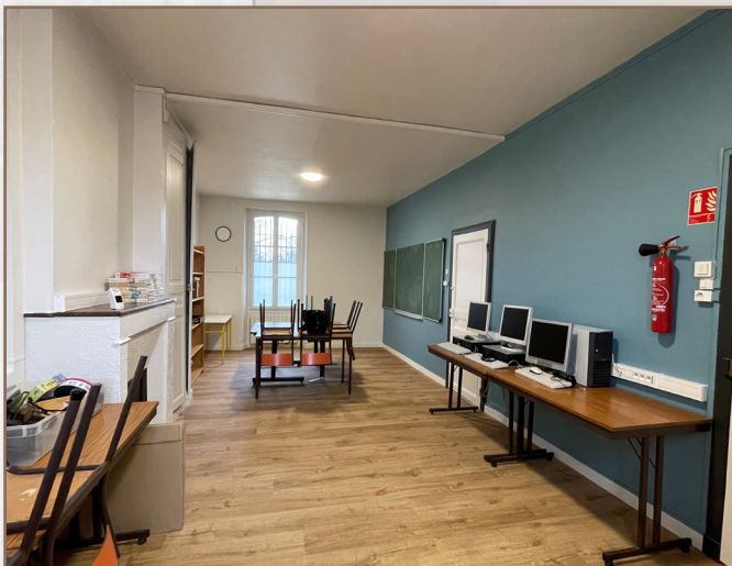
Rénovation salle informatique et vestiaire de l'école élémentaire