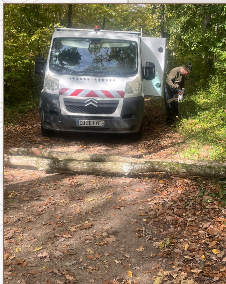
Intervention des services techniques