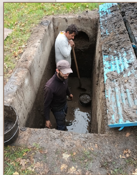
Entretien de la voirie