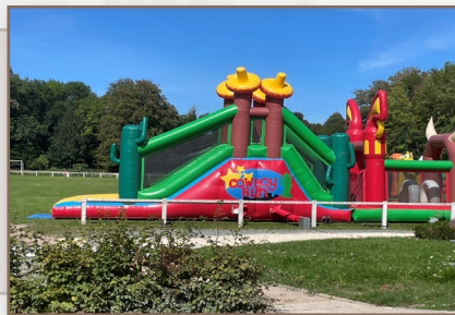
Souvenir du forum des associations