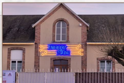
Illuminations de fin d'année après réparation du bandeau lumineux.