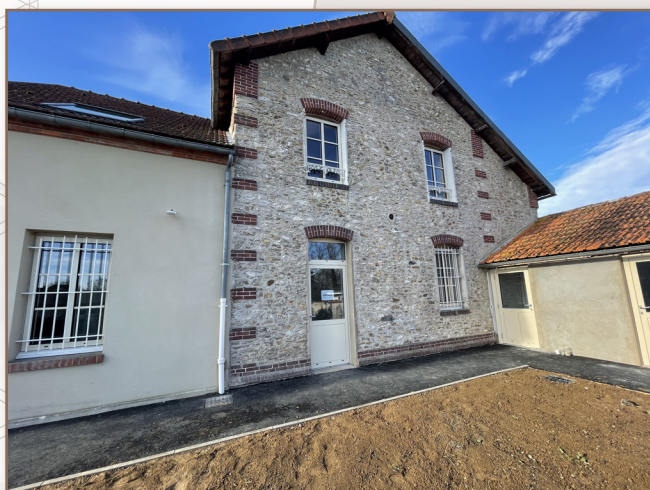
Porte d'entrée coté parking