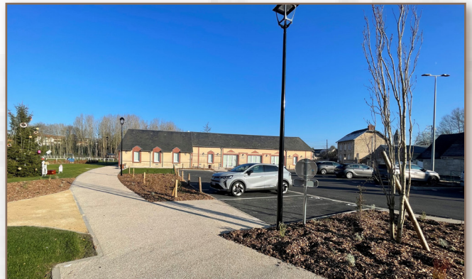
Liaison piétonne desservant le foyer communal, l'aire de jeux, l'école élémentaire et la mairie. Stationnement réservé et desserte vers l'accès PMR des services de la mairie et de la Poste